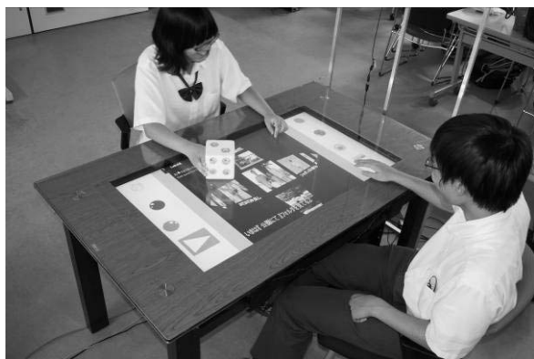
図1 暖 LaN テーブル

本システムでは、「暖 LaN テーブル」(図1) という食卓を用意しました。このテーブルを家族で囲むことで、楽しい時間を過ごすことができます。「暖 LaN テーブル」は 42 型液晶ディスプレイとパソコンからなり、3 章に示す 6 つの機能が組み込まれています。