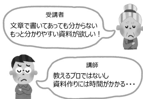
図 1 受講者と講師の悩み

私たちは「分かりやすい資料」は 動画 であると考え、 動画資料を用いた学習と動画資料の作成 を支援するアプリケーション『STEP APP!!』を開発しました。