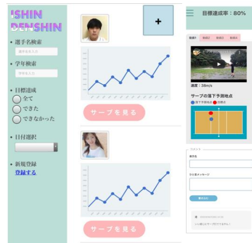
図2 webページでの閲覧画面

分析の結果とサーブ動画をwebページにて閲覧することができます。コメント機能を用いて指導者からアドバイスを受けたり、チームメイト同士でやりとりすることでチームとしての力をあげることができます。