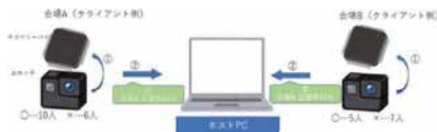
図2 遠隔通信システムの構成と処理

ートでホスト側と共有する。また映像に関しては、クライアント側の PC で加工した(エフェクトを追加した)映像を Zoom にながして共有する。