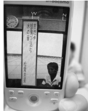
図2 俳句拝読機能の実行画面(開発中)

そこで私たちは手軽に旅先で俳句を詠むことを実現させるこのシステムを開発しました。