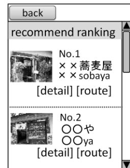
図 3. ランキングイメージ (和食が好きな場合)

利用者があらかじめ登録したアレルギーや宗教などの情報を基に、利用者の食事制限にかかわる材料を含んだ料理に警告を表示します(図 2)。べらぐるメニューにより、食事制限のある人でも安心して食事ができます。