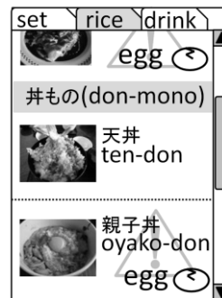
図 2. メニューイメージ (卵アレルギーの場合)

べらぐるメニューは、取り扱っている料理とその価格や材料などの料理情報を飲食店が登録することにより、飲食店ごとに作成されます。飲食店は、利用者がべらぐるメニューへアクセスするための QR コードを既存のメニューに貼付します。利用者は QR コードを読み取り、料理情報を閲覧します。さらに、