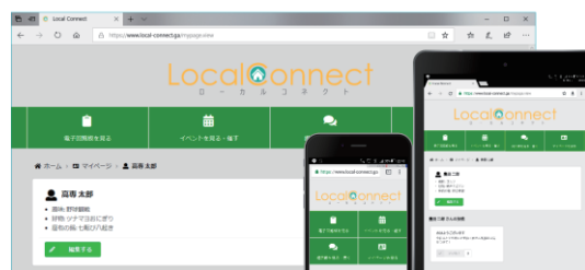
図2 実際の動作画面(ブラウザ・スマホ・タブレット) 使用言語: HTML, CSS, JavaScript 実行環境: Node.js

私たちの開発した「ローカルコネクト」は名古屋市天白区役所の職員の方や、住民の皆様と協力していただき、実際に使ってもらうなかで得られた生の声を取り入れて作成した実用化に向けたシステムです。日本全国の街でのコミュニケーションを活性化し、地域に人を呼び込む第一歩を創り上げます！