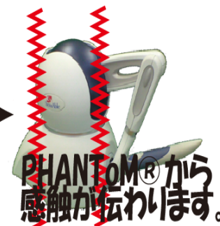
図2 触感のイメージ図