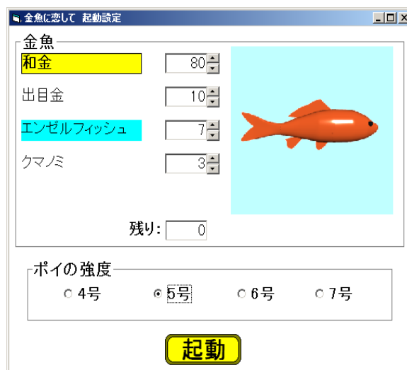
図3 道具と魚の選択

ポイの強度を好みの強さに選択することができ、初心者の方でも簡単にすくうことができます。また、いろんな種類の魚を選ぶことができます。定番の金魚や出目金、更にはあんな魚まで!?