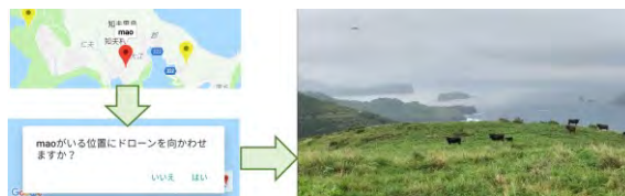
図4. ドローンでの撮影の流れ

ドローンが撮影した牛の様子はアプリで見ることができます。利用者が映像を見ることで、種付け、分娩などの予定を立て、カレンダー機能によりすぐメモをすることができます。