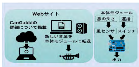
図 1. システム構成

CanGakki は、Web サイトと本体モジュールで構成されています。システム構成を図 1 に示します。