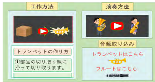
図 3. Web サイトの例

Web サイトに、工作手順動画や基本的な演奏方法動画を載せます。Web サイトの例を図 3 に示します。動画を載せることによって、図面だけでは伝えきれない動きを効果的に伝えることができます。