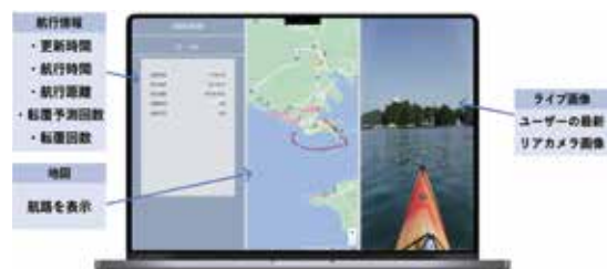
図5 ダッシュボード